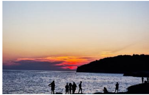
Sommercamp 2023. Pula

Kosten: 650.- (Für Mitglieder unserer Kirchgemeinde nur 500.-) Es dürfen alle Jugendlichen mitkommen, die Lust haben. (Bei Zugehörigkeit zu einer anderen Kirchgemeinde kann evtl. diese für