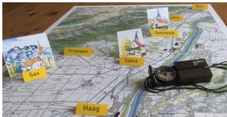
Sich finden: 7 Dörfer - 3 Kirchen - 1 Kirchgemeinde