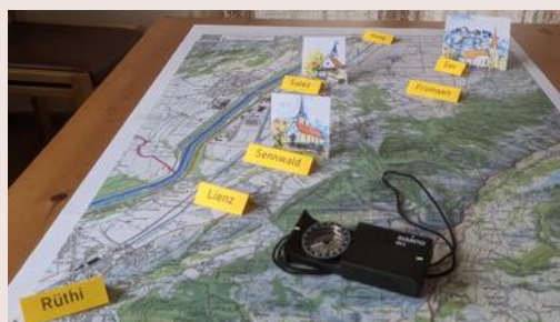
verschiedene Menschen - verschiedene Perspektiven

Um unser Kirchenschiff, respektive unsere Kirchgemeinde, gut in Fahrt zu halten, sind wir auf festangestellte Personen angewiesen. Die knapp zweijährige Suche nach einer zweiten Pfarrperson blieb leider erfolglos und die eingesetzte Pfarrwahlkommission wurde aufgelöst. Es stellt sich die Frage, ob die unbesetzte 2. Pfarrstelle nicht zwingend durch eine Pfarrperson besetzt werden muss, sondern auch durch eine Person aus dem diakonischen oder religionspädagogischen Bereich abgedeckt werden könnte. Darüber muss letztlich an der Kirchgemeindeversammlung befunden werden. Gerne möchten wir unsere Situation mit unseren Kirchbürgern und Kirchbürgerinnen be-