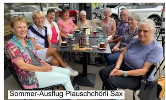
Sommer-Ausflug Plauschchörli Sax