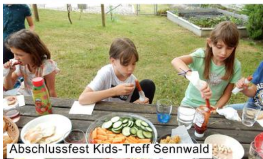
Abschlussfest Kids-Treff Sennwald