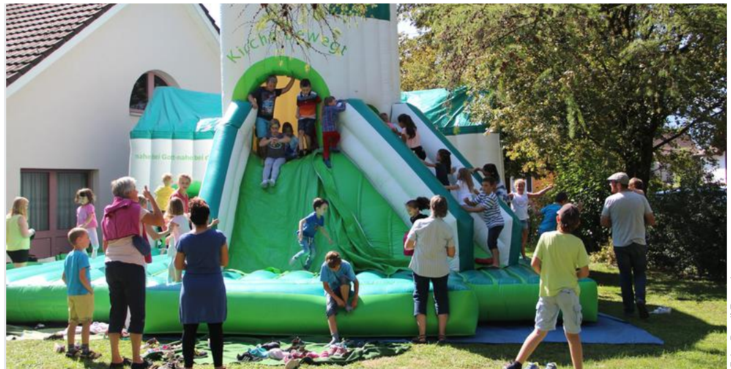
Die grosse Hüpfkirche ist ein Hit!