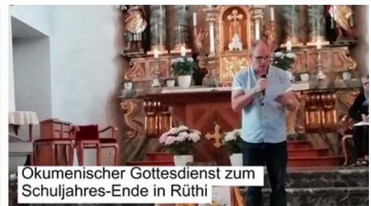
Okumenischer Gottesdienst zum Schuljahres-Ende in Rüthi