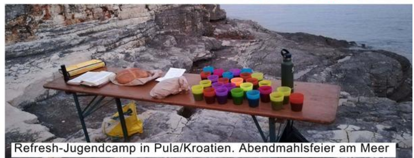
Refresh-Jugendcamp in Pula/Kroatien. Abendmahlsfeier am Meer